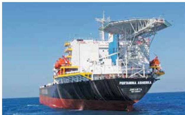
FSO Abherka saat berada di perairan utara pulau Madura