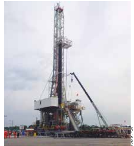
Kegiatan pengeboran di Lapangan Banyu Urip.

Untuk itu, Firman bersama para engineer PEPC yang tergabung dalam tim kerja PC Prove Amada Reborn mencari alternatif metode lain sebagai solusi untuk mengatasi masalah total loss circulation di Lapangan Banyu Urip. Setelah mengevaluasi sejarah penanganan loss circulation sumur-sumur pengeboran di Banyu Urip, terutama sumur-sumur eksplorasi, pilihannya jatuh