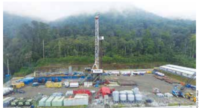
Kegiatan pengeboran sumur HLS-E3 di Area Geothermal Hululais, Rejang Lebong – Bengkulu.

Menurut Zainuddin, kondisi tersebut sebenarnya bisa diatasi dengan cara melakukan pengeboran aerasi (pengeboran dengan menggunakan udara dan fluida). Yaitu, menciptakan kondisi under balanced di dalam sumur sehingga cutting pengeboran dapat terangkat ke permukaan. Namun, masalahnya dalam operasi aerated selama ini masih menggunakan metode konvensional, dengan desain parameter dilakukan secara trial dan error . Akibatnya, dari sisi engineering practice tidak mendapatkan desain yang baik, hasil pun tidak optimal karena cutting tidak terangkat sepenuhnya. "Mengantisipasi permasalahan tersebut kami melakukan suatu inovasi dengan merancang perangkat lunak dinamakan Pertamina Aerated Drilling Simulator (PADSim). Tujuannya, untuk optimasi desain parameter pengeboran aerasi pada pengeboran sumur-sumur geothermal. Optimasi dilakukan dari fase pre-drilling , saat operasi, dan pasca-drilling atau