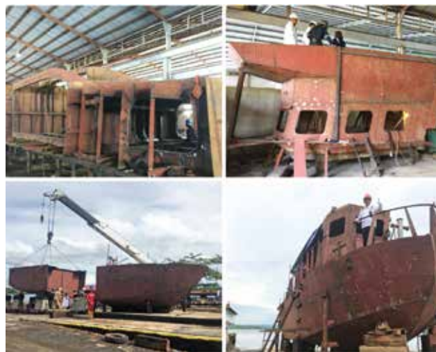
Proses assembly mooring boat di Slipway II.

Head of Dockyard Sorong Daniel Tampubolon menyampaikan terima kasih atas kepercayaan dan dukungan yang telah diberikan oleh perusahaan sehingga pembangunan mooring boat ini menjadi pondasi kepercayaan diri bagi Pertamina Dockyard Sorong untuk mempromosikan keberadaan dan kemampuannya di bidang bisnis galangan kapal di Indonesia. Sekalipun berada di bagian timur Indonesia, yakni Papua Barat, menjadi suatu kebanggaan bagi Pertamina Dockyard Sorong dapat menjadi andalan bagi Pertamina untuk menghadapi persaingan di masa yang akan datang. •