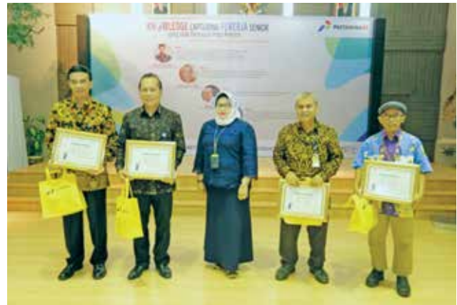
VP HR Pertamina EP memberikan penghargaan kepada para narasumber.

Empat narasumber pada acara kick off ini antara lain :