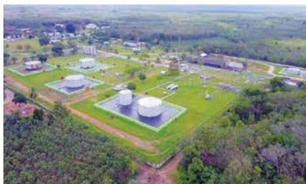
Fasilitas produksi pusat pengumpul produksi Pangabuan, Sumatera Selatan.

Menurut Rudhy, jumlah 31 sumur, di atas masih ditambah lagi dengan rencana reaktivasi sumur suspended dari program pilot waterflood , fungsi EOR sebanyak 22 sumur di struktur Abab dan Dewa. Pada 2019 akan dilakukan pengeboran sumur DWA-18.1 atas usulan