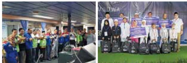
Terminal – Makassar. Acara tersebut dihadiri oleh tim management Shipping yang diwakili oleh VP Commercial, SMR Manager, dan Ship Operation I Manager.

Keseluruhan program tersebut terselenggara dengan baik, tentunya dengan support yang luar biasa oleh BDI Perkapalan. Semua dana dan barang yang terkumpul merupakan sumbangan dari seluruh pekerja yang ada di lingkungan Shipping (baik pekerja darat dan crew kapal). Di awal bulan Ramadhan Shipping membuka program Ramadhan dengan Wakaf Al-Qur'an. Al-Qur'an yang terkumpul ditujukan untuk Masjid Nurul Bahri Shipping, Masjid Shipping Sunter, kemudian dibagikan kepada beberapa Masjid lainnya di daerah Jakarta. Masih dalam suasana Ramadhan, Shipping juga mengadakan acara Safari Ramadan sekaligus silaturahmi ke kapal yang berada di Bosowa