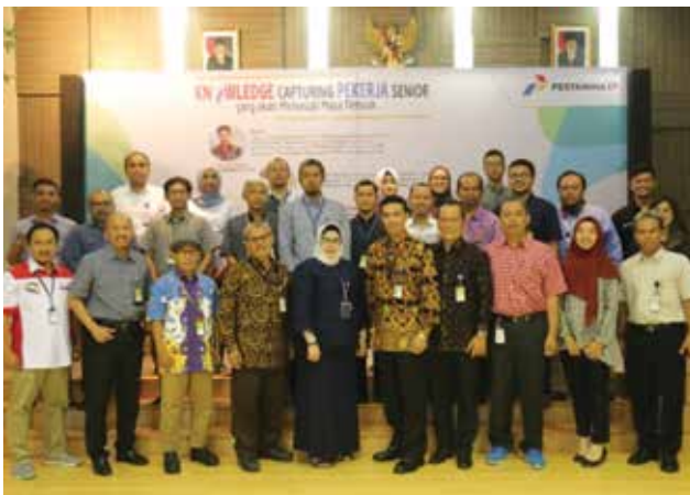
Narasumber Knowledge Capture bersama Manajemen PEP

Sebagai anak perusahaan Hulu yang paling awal berdiri, Pertamina EP menjadi pionir dan yang pertama melaksanakan Program Knowledge Capture pekerja senior yang akan memasuki masa Purna Karya.