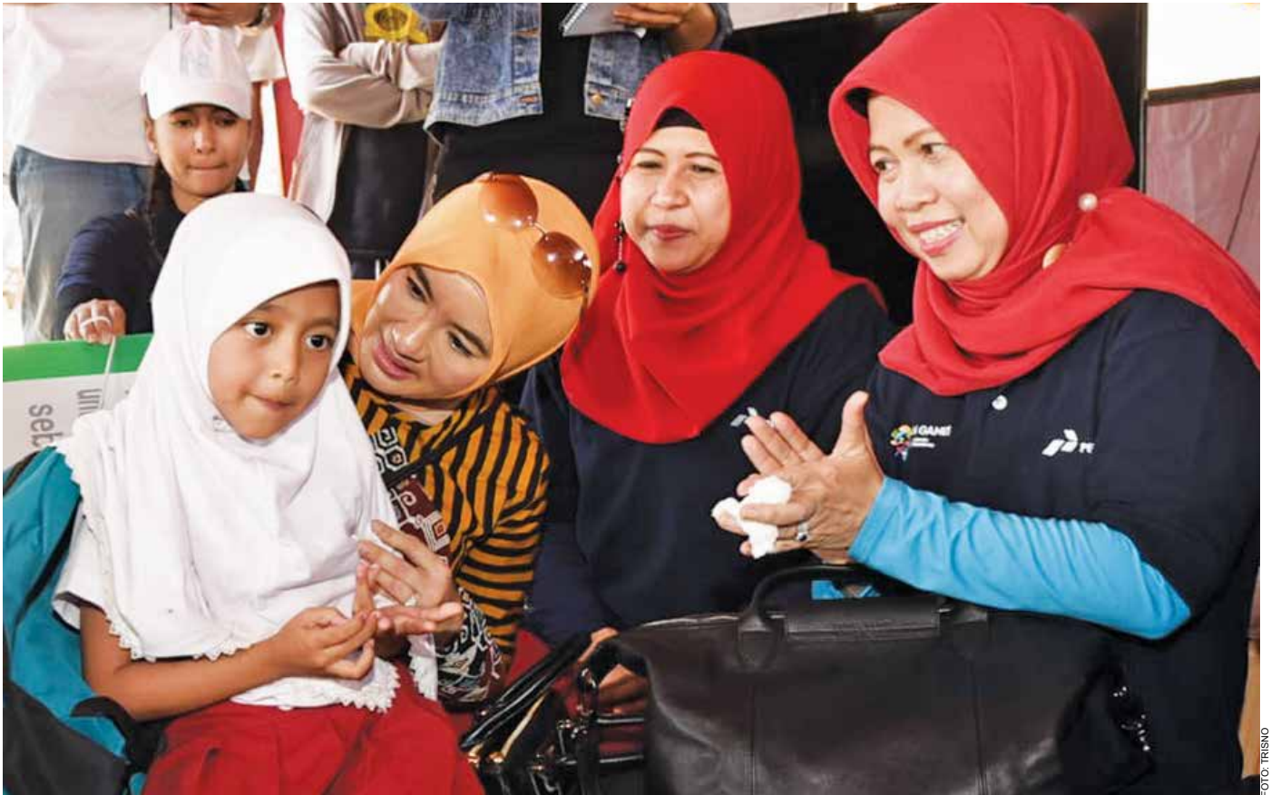
Direktur Utama Pertamina Nicke Widyawati bercengkrama dengan anak-anak pegungsi Lombok saat meninjau kompleks rumah percontohan tahan gempa di pos 3 Pertamina Peduli Gempa Lombok, Desa Pemenang Timur, Kecamatan Pemenang, Kabupaten Lombok Utara, pada Selasa (18/9/2018).