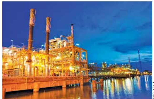
Fasilitas pengolahan Lapangan Handil - Kaltim.

sebesar 0,71 MMBBL, dengan total oil, gas, dan kondensat sebesar 4,80 MMBOE, atau 115% dari prognosis. "Semua pencapaian itu merupakan bukti kerja keras dan kolaborasi cerdas yang mampu mencairkan sekat-sekat kultur korporat pengelola lama dengan Pertamina selaku pengelola baru," ujar Bambang.