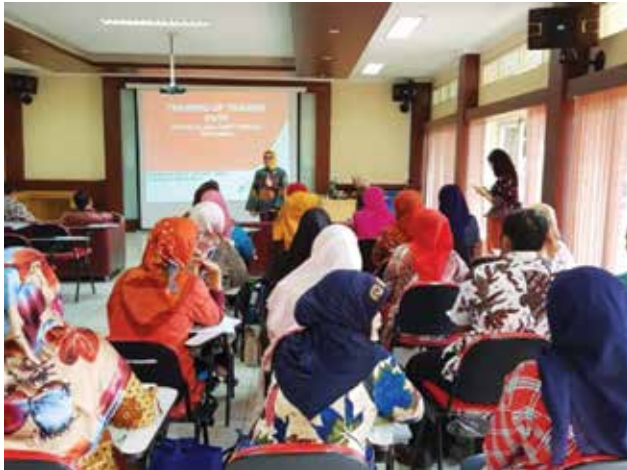
Pemaparan PATP di Asset 2 Pertamina EP

Seiring dengan komitmen Pertamina untuk menjadi perusahaan energi nasional kelas dunia, Fungsi System & Business Process (SBP) – Quality, System & Knowledge Management (QSKM) turut berkontribusi melalui dukungan terhadap pelaksanaan dan pengembangan sistem tata kerja berbasis proses bisnis serta implementasi office management di seluruh Pertamina. Salah satu wujud nyata kontribusi ini adalah dengan melaksanakan sosialisasi dan memfasilitasi standarisasi Pengelolaan Administrasi Terpadu Pertamina (PATP) dan Manajemen Sistem Tata Kerja Pertamina (MSTKP) di berbagai lini bisnis Pertamina secara berkesinambungan.