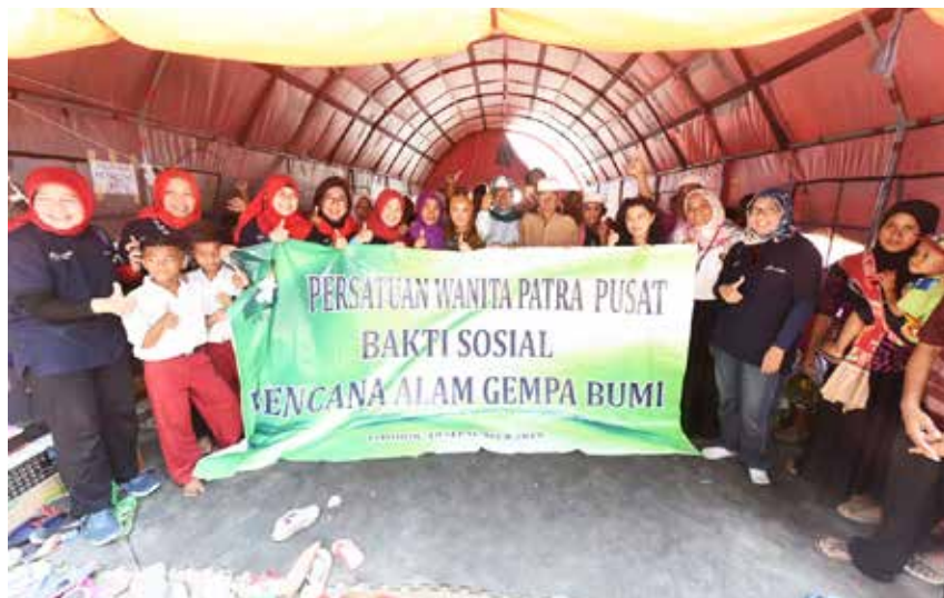
Secara simbolis Direktur Utama PT Pertamina (Persero) Nicke Widyawati bersama Persatuan Wanita Patra (PWP) memberikan bantuan sebesar Rp 50 juta kepada korban gempa Lombok, pada (18/9/2018).

"Tidak hanya itu, kita sudah membangun sarana untuk sekolah sementara yang bisa juga digunakan untuk sarana ibadah. Inshaallah , Senin (24/9/2018) sudah bisa digunakan. Kita sedang membangun SD sampai SMA, dan