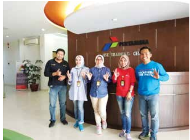
Tim SBP dan Tim HSE Training Center

Tidak hanya sampai disitu, tim SBP melanjutkan wujud kontribusinya dalam mendorong pencapaian perusahaan dengan melakukan sosialisasi MSTKP. Kali ini, sosialisasi MSTKP dilaksanakan