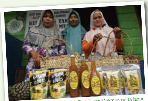
Budidaya nanas oleh Kelompok Tani Tunas Makmur, pada lahan gambut seluas 14,5 hektar yang berada di Kampung Jawa, Kelurahan Sungai Pakning, Kecamatan Bukit Batu, Kabupaten Bengkalis, Provinsi Riau. Komoditi Nanas : Buah Segar, keripik, dodol, manisan, kerupuk, tas serba guna.