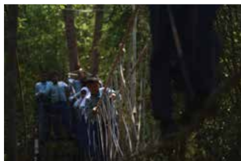
Pertamina membina 25 sekolah dasar di Kecamatan Bukit Batu, Kecamatan Bandar Laksamana, Kecamatan Siak Kecil untuk mendorong terciptanya gerakan sekolah adiwiyata berbasis lingkungan.