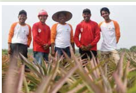
Mitigasi Karhutla Berbasis Masyarakat Peduli Api dengan membina warga Kampung Jawa, Kelurahan Sungai Pakning, Kecamatan Bukit Batu, Kabupaten Bengkalis, Provinsi Riau untuk mengurangi risiko kebakaran lahan seluas 3.400 hektar dan menciptakan enam jenis profesi baru : fireman, petani jamur tiram, peternak lele, petani nanas, peternak madu, dan pengelola arboretum gambut.