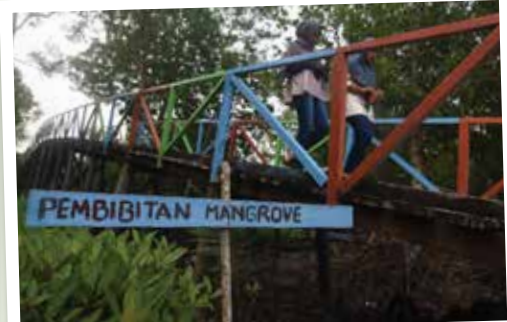
Pertamina melakukan peletarian mangrove terapan seluas 30 hektar untuk mengatasi abrasi sepanjang 1 km di Desa Pangkalan Jambi, Kecamatan Bukit Batu, Kabupaten Bengkalis, Provinsi Riau.