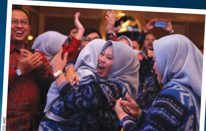
Suasana haru terjadi saat satu per satu nama Pertamina Contact Center (PCC) disebut dan mendapatkan penghargaan dalam ajang tahunan "The Best Contact Center Indonesia 2019" yang digelar oleh Indonesia Contact Center Association (ICCA) di Hotel Shangri-La, Jakarta Pusat, (10/9).