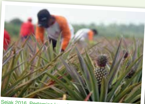
Sejak 2016, Pertamina kucurkan dana Rp 3 miliar untuk mencegah kebakaran lahan gambut dan kerusakan hutan mangrove di area seluas kurang lebih 3.600 hektar yang berada di Kabupaten Bengkalis, Provinsi Riau.

Hal ini mendorong Pertamina untuk menginisiasi sejumlah program CSR dalam melestarikan lahan gambut dari kebakaran hutan dan pemanfaatannya lewat beberapa program yang diterapkan. Antara lain, Kampung Gambut Berdikari, Mitigasi Kebakaran Hutan dan Lahan (Karhutla) Berbasis Masyarakat Peduli Api, Pendidikan Kurikulum Sekolah Cinta Gambut dan Pelestarian Mangrove Terapan.