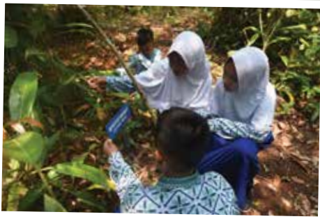
Wisata edukasi di lahan seluas 1,1 hektar yang berisikan tanaman endemik gambut dan wahana bermain anak-anak. Arboretum ini diharapkan tidak hanya sekedar objek wisata, melainkan sarana edukasi bagi masyarakat untuk belajar lebih mencintai lingkungan.