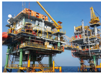
Platform offshore PHE WMO

Akibatnya komposisi N, m, dan We yang diperlukan untuk melakukan matching terhadap data produksi dan tekanan tidak dapat ditentukan dan hanya diasumsikan. Sedangkan pada metode InTel, PC Prove