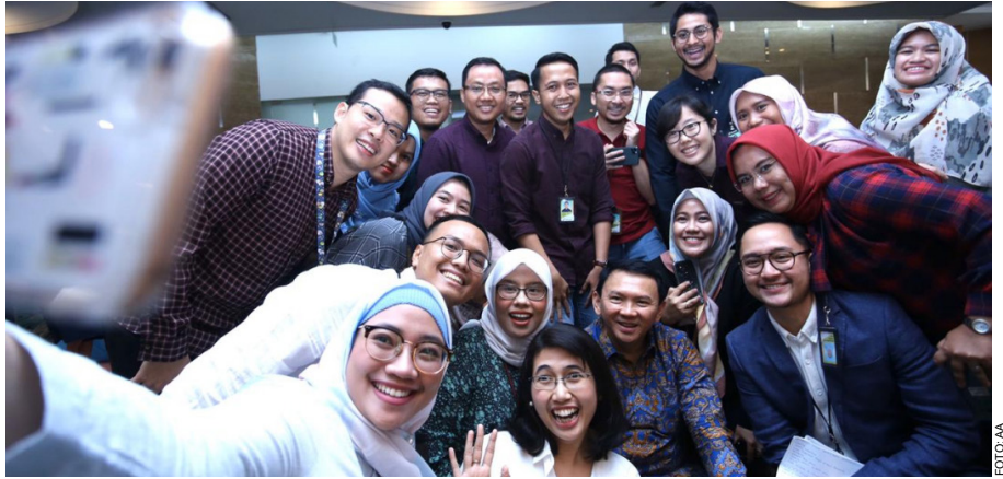
Komisaris Utama PT Pertamina (Persero) Basuki Tjahaja melakukan foto bersama dengan para peserta inspiring talk yang di adakan oleh fungsi SDM Culture Change Agent (CCA) di lantai 21 Gedung Utama Pertamina Pusat, Jakarta Pusat, Jumat, (31/01/2020).

Pertamina akan lebih transparan, sebagai salah satu langkah awal agar publik juga lebih tahu apa yang dilakukan Pertamina. "Kita harus transparan. Jadi kalau mau dipercaya oleh stakeholders salah satunya dengan transparansi. Data-data yang perlu diketahui publik harus dipublikasikan di website resmi Pertamina," imbuhnya.