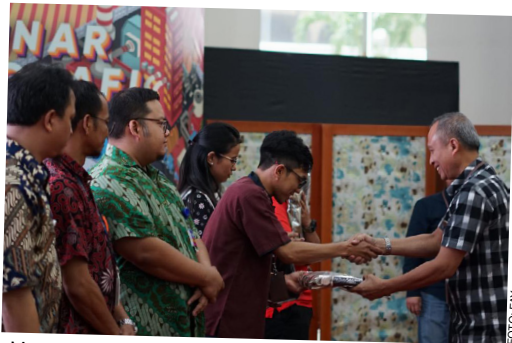
Manager HSE Management Asset & Head Office Arfentyas menyerahkan apresiasi kepada pemenang lomba cerdas cermat dalam rangka peringatan Bulan K3 di lantai ground Gedung Utama Kantor Pusat Pertamina, (7/2).

Dalam rangka memperingati Bulan K3 Nasional yang ditetapkan pemerintah mulai 12 Januari hingga 12 Februari, Pertamina mengadakan berbagai kegiatan untuk meningkatkan kesadaran pekerja terhadap aspek HSSE. Berikut beberapa cuplikan kegiatan yang dilakukan di kantor pusat, unit operasi, dan anak perusahaan