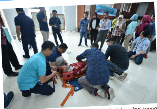
Peserta pelatihan first aid mengikuti praktik didampingi tenaga ahli dari RSPP. Mereka diajarkan cara membawa korban cedera dengan menggunakan tandu, penanganan pertama korban pingsan yang membutuhkan pernapasan buatan, dll, di Kantor Pusat Pertamina, Selasa (11/2).