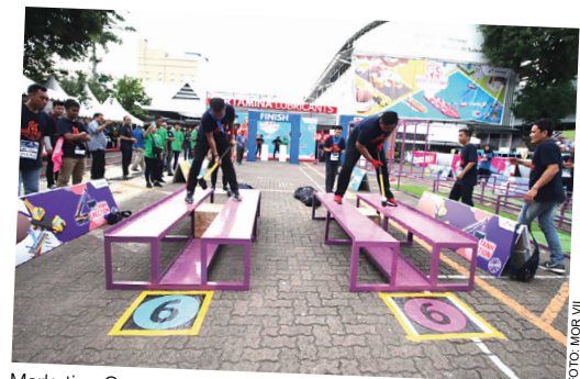
Marketing Operation Region (MOR) VII secara rutin mengadakan kegiatan HSSE Ewako dalam rangka memperingati Bulan K3 Nasional. Beberapa bentuk kegiatannya adalah lomba Fire Combat, Incident Investigation, Working at Height, Confined Space Rescue & Medical Evaluation, Safety Riding and Driving yang diikuti pekerja, mitra kerja, vendor dan kontraktor MOR VII.