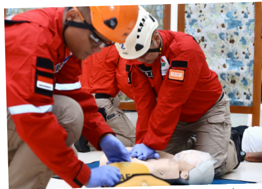
Memperingati Bulan K3 Nasional tahun 2020, Pertamina mengadakan lomba first Aid yang diikuti oleh 14 regu di lantai ground Gedung Pusat Pertamina, Jakarta, Rabu, (12/2).