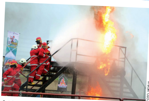
Salah satu tim semangat mengikuti kompetisi JAWARA 2020 saat mengikuti ketangkasan untuk memadamkan api. Acara yang diadakan Marketing Operation Region (MOR) III diadakan di MTC Fireground Plumpang, Jakarta Utara, (3/2).