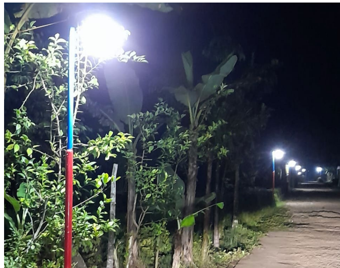
Suasana jalan di Dusun Sambirejo setelah dipasangi penerangan jalan.

"Semoga dengan bantuan penerangan lampu jalan ini,