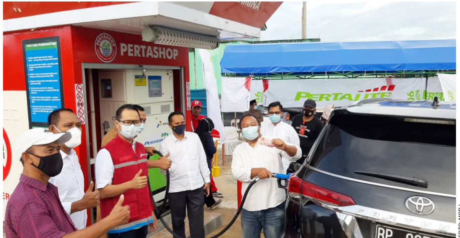
Proses pengisian perdana Pertamina ke mobil sebagai tanda beroperasinya Pertashop di Kelurahan Sei Lekop, Kecamatan Sagulung, Kota Batam, Kepulauan Riau.

"Kita membangun Pertashop ini untuk mendukung program pemerintah agar mendekatkan dan mempermudah