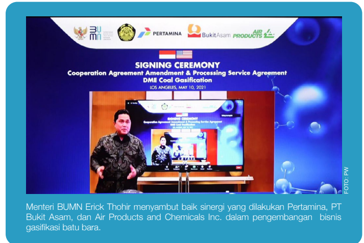
Menteri BUMN Erick Thohir menyambut baik sinergi yang dilakukan Pertamina, PT Bukit Asam, dan Air Products and Chemicals Inc. dalam pengembangan bisnis gasifikasi batu bara.