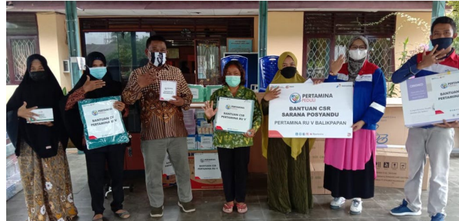
Pertamina secara simbolis menyerahkan bantuan untuk Posyandu di Penajam Paser Utara, Kalimantan Timur.

Chandra menjelaskan, pelaksanaan program tersebut juga sejalan dengan program pemerintah yang tertuang dalam Tujuan Pembangunan Berkelanjutan. "Program ini sejalan dengan Tujuan Pembangunan Berkelanjutan Poin 3, yaitu Kehidupan Sehat dan Sejahtera," katanya.