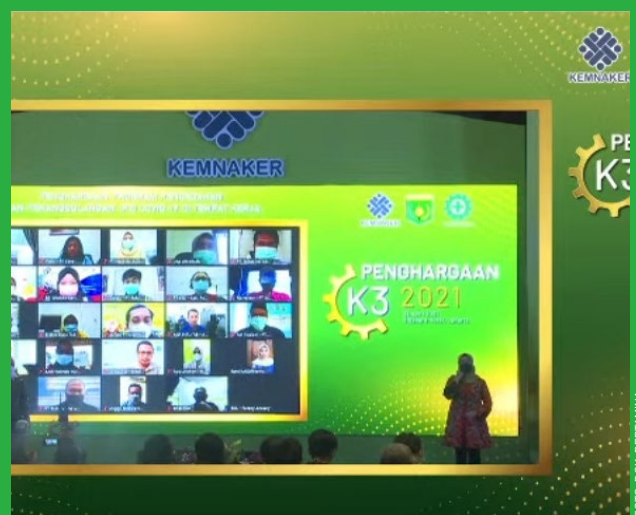
Penghargaan Zero Accident diumumkan secara daring oleh Kementerian Ketenagakerjaan, Rabu (28/4).