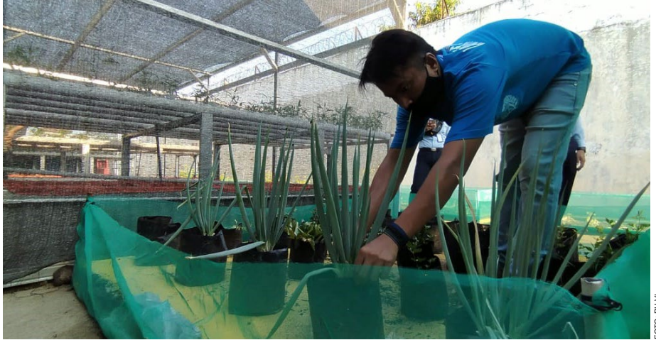
Seorang warga binaan Lapas Indramayu melakukan perawatan tanaman organik.

Selain itu, potensi pasar maggot cukup besar karena banyak digunakan sebagai pakan ternak. Harga jual Prepupa (Maggot kering) di pasaran pun cukup tinggi, sekitar Rp100.000 per kilogram.