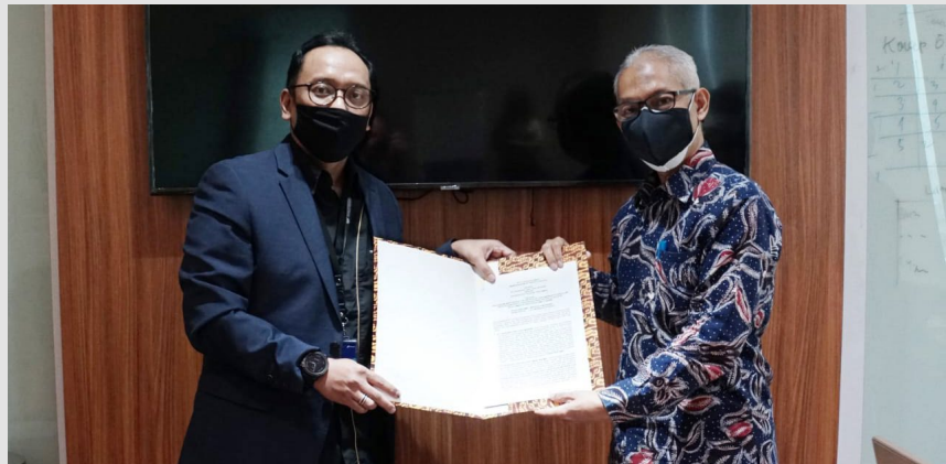
Donor darah yang dilakukan oleh perwira Perta Arun Gas diharapkan dapat bermanfaat bagi masyarakat yang membutuhkan.

"Di sini, para siswa akan diberi bekal pengetahuan seputar perasuransian, termasuk pengetahuan sistem digitalisasi yang dikembangkan di AJTM. Pengetahuan serta pengalaman praktik kerja tersebut diharapkan akan menjadi modal yang bermanfaat bagi para siswa sebagai generasi penerus, saat mereka terjun ke dunia kerja. Kami berharap kerja