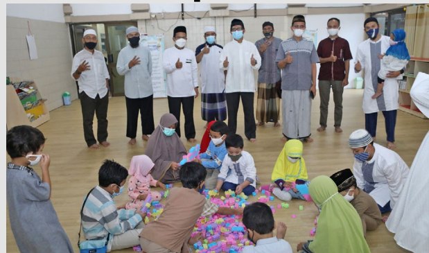
Anak-anak asyik bermain lego di edupark yang disediakan Kilang Cilacap di area Masjid Baiturrahim.