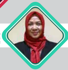
GUSNIDA VP Enterprise Risk Management - Dit. PIMR