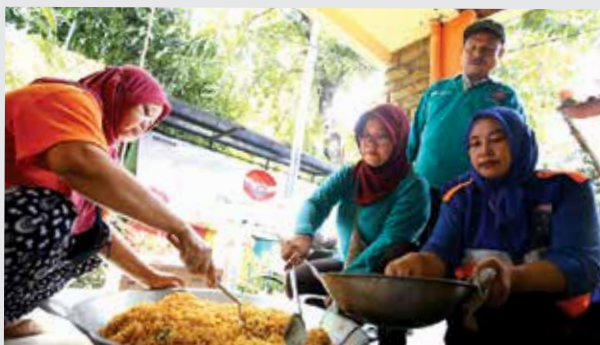
Sejumlah Ibu Pemberdayaan Kesejahteraan Keluarga (PKK) kelurahan Sukapura sedang menyiapkan kebutuhan makanan untuk korban pengungsi di Kelurahan Kelurahan Sukapura, Kecamatan Cilincing, Jakarta Utara, Kamis, (2/1/2020). Bantuan tersebut berupa 10 tabung Bright Gas 15 kg, Sembako, dan kebutuhan balita.