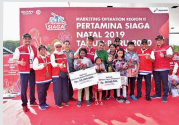
Komisaris Pertamina Condro Kirono secara simbolis menyerahkan bantuan kepada dua panti asuhan di Lampung, Panti Asuhan Kasih Nusantara dan Panti Asuhan Eiben Lezer, masing-masing sebesar Rp50 juta. Anak-anak panti tersebut juga menerima bingkisan souvenir alat-alat sekolah. Bantuan tersebut diserahkan di sela-sela kunjungannya memantau kesiapan tim Satgas Nataru di SPBU Km 234 yang berada di jalur tol Trans Sumatera, Senin (30/12).