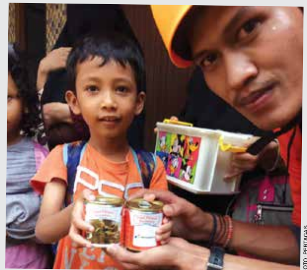
PT Pertamina Gas bekerja sama dengan Rumah Zakat menyalurkan bantuan untuk korban bencana banjir di beberapa posko, Rabu (1/1). Sebanyak 1.852 kemasan makanan siap santap disalurkan oleh 30 relawan RZ yang bekerjasama dengan Pertagas.