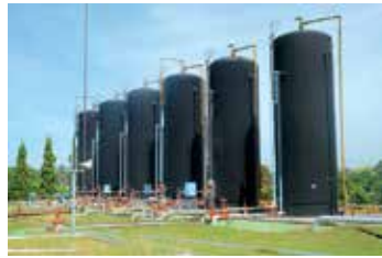
Fasilitas Produksi PEP Asset 1 Lirik Field.