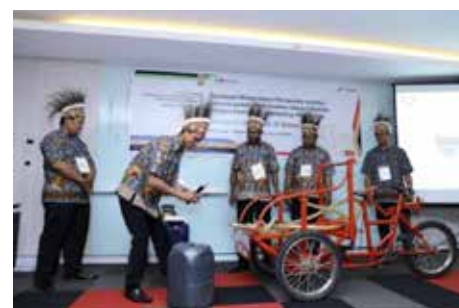
Salah Satu Gugus CIP Saat Presentasi dengan Alat Peraga