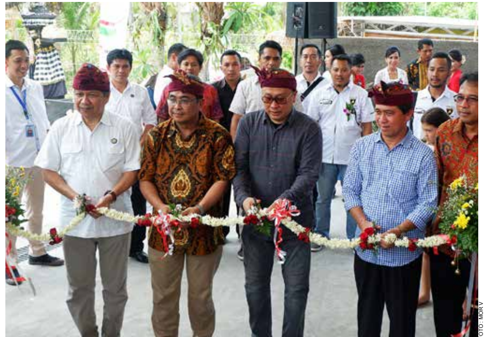
Pemotongan pita sebagai tanda diresmikannya SPBU Kompak 3T di Klungkung, Nusa Penida, Bali, pada Sabtu (4/11/2017).

Upaya Pertamina merealisasikan BBM satu harga di beberapa wilayah sejalan dengan Permen ESDM Nomor 36 Tahun 2016 tentang Pemberlakuan Satu Harga Jenis BBM Tertentu (JBT) dan Jenis BBM Khusus Penugasan (JBKP) secara nasional yang diberlakukan sejak 1 Januari 2017. Walaupun melaksanakan tugas negara