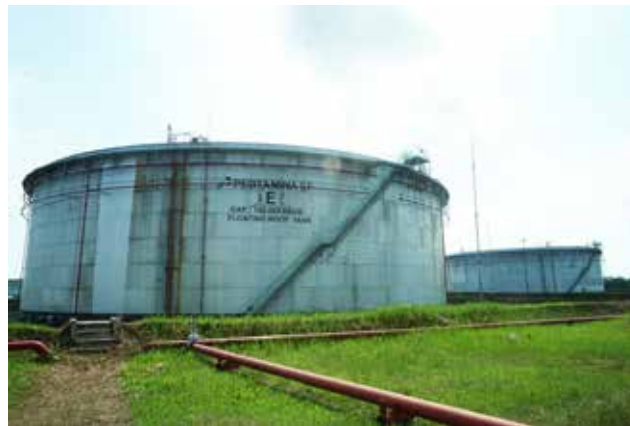
Fasilitas produksi Main Gathering Station (MGS) Pangkalan Susu Field, Sumatera Utara.

lapangan yang sudah sangat mature . Selain itu, peningkatan diperoleh dari pengoperasian Struktur Langsa dengan produksi minyak sebesar 831 BOPD dari bulan Juni 2017, reaktivasi sumur-sumur suspend dengan upgrading surface facilities sebesar 137 BOPD, reaktivasi sumur-sumur penghasil gas di shallow zone pada Struktur Pulau Panjang sebesar