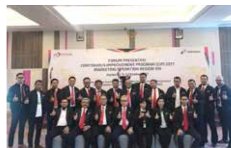
Tim Manajemen MOR VIII Beserta Juri CIP

Forum CIP MOR VIII kali ini melibatkan 228 pekerja sudah termasuk dari TBBM dan DPPU serta 7 orang juri. Pada kesempatan kali, berkat dukungan yang besar dari GM MOR VIII beserta jajaran Tim Management, hampir semua TBBM dan DPPU menghasilkan minimal 1 risalah CIP. Hal ini dapat