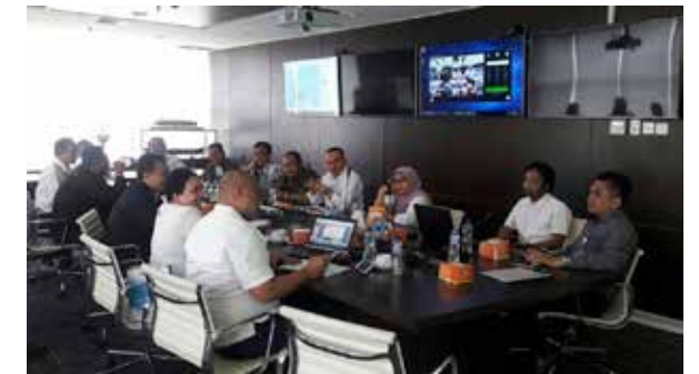
Pembahasan Kelanjutan Kerjasama

Pertamina berharap galangan-galangan BUMN tersebut dapat bersinergi yang saling menguntungkan dalam pengembangan galangan milik Pertamina melalui joint venture dan semacamnya, di samping hanya mendapatkan bisnis perbaikan dan pembangunan kapal milik Pertamina, sebagai bagian implementasi kerjasama di bidang Perkapalan yang sudah disepakati. ●SHIPPING