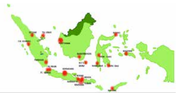
21 Lokasi TBBM yang di survey :