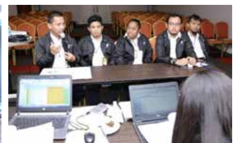
Interview Gugus CIP MOR VIII

menjadi bukti nyata bahwa kegiatan CIP terus menggeliat menjadi budaya continuous improvement di MOR VIII Maluku-Papua.