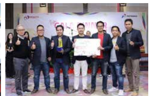
Salah Satu Peraih Predikat Gold pada Forum Presentasi CIP MOR VIII