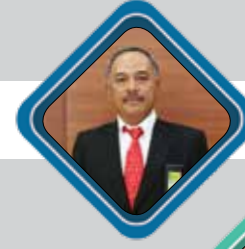
SAHADI VP Project HSSE Direktorat Megaproyek Pengolahan & Petrokimia