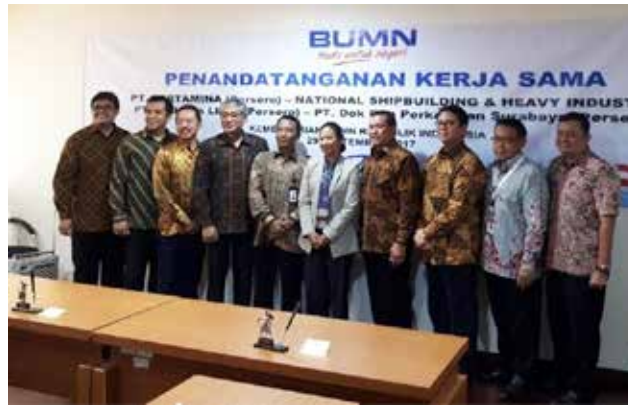
Penandatanganan Kesepakatan Kerjasama Antara PT Pertamina (Persero) dan 4 Galangan BUMN

Secara umum, acara tersebut mendiskusikan kemampuan atau kapasitas setiap galangan dalam mendukung kebutuhan perbaikan dan pembangunan kapal milik Pertamina. Di samping itu, juga dibahas kendala-kendala yang berpotensi menghambat realisasi dari kesepakatan kerja sama yang dibuat, seperti outstanding yang belum terselesaikan dari galangan terhadap proyek sebelumnya, permasalahan manajemen